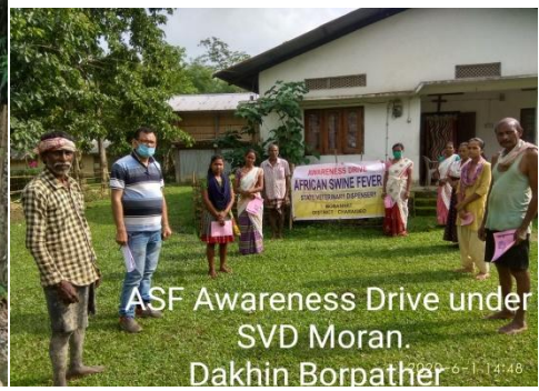
ASF Awareness Drive under SVD Moran. Dakhin Borpathar